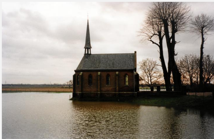
Sint-Annakapel tijdens overstromingen (1993).

Hoewel de viering in 2021 specifiek gericht was op het 125-jarige bestaan van de huidige kapel is de Annadevotie te Ohé en Laak veel ouder. De oude Sint-Annakapel dateerde van vóór 1631 en behoorde oorspronkelijk bij de parochie Stevensweert. Het oude kapelletje lag ongeveer op de grens van de vroegere heerlijkheden (en latere gemeenten) Stevensweert en Ohé en Laak. Over het uiterlijk van de oude kapel is vrijwel niets bekend. Vanwege de ligging in een laagte had deze kapel regelmatig last van de hoge waterstand van de rivier de Maas en optrekkend vocht in de muren. Juist vanwege deze ongunstige ligging werd de oude kapel in januari 1896 afgebroken.